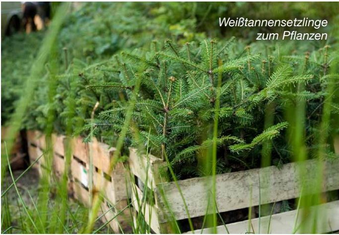
Weißtannensetzlinge zum Pflanzen