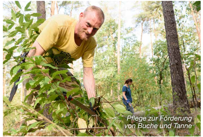
Pflege zur Förderung von Buche und Tanne